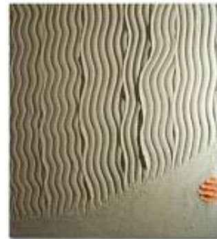
10-11/Apr 10 modellare